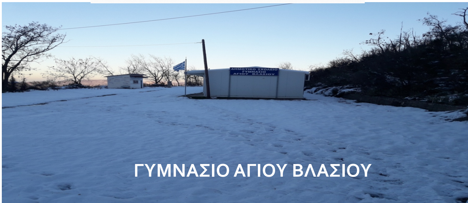
ΓΥΜΝΑΣΙΟ ΑΓΙΟΥ ΒΛΑΣΙΟΥ